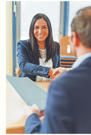
Gute Position: Fühler Bewerber haben aufgrund des Fachkräftemangels bei Einstellungsge- süchten eine gute Verhandlungsposition.